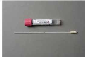
E-swab (verkrijgbaar bij MMI)