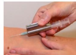
het opzuigen van materiaal

Alleen bij zeer kleine hoeveelheden de pus met behulp van een E-swab afnemen.