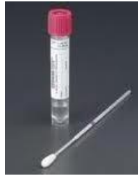
Eswab (verkrijgbaar op het MMI)